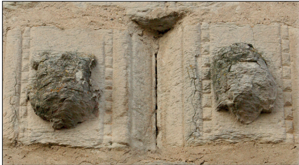
Wiederverwendete Gewändesteine mit verwitterten Fratzen in der Kirchenburgmauer.