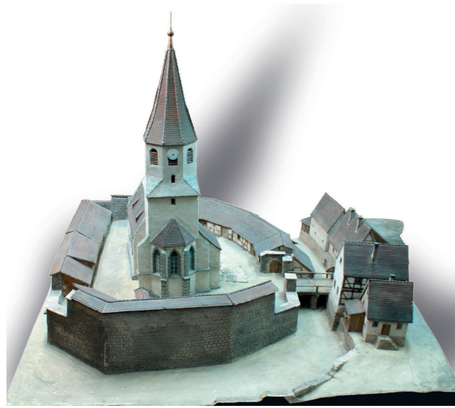
Kirchenburg mit Graben und Brücke (Modell im Heimatmuseum Mühlacker).

Sie gehört zu den besterhaltenen Anlagen ihrer Art. Die in ihrem Zentrum errichtete Peterskirche von 1467/1499 geht wohl auf eine 1186 erwähnte „ecclesia“ zurück. Damals lagen Kirche und Friedhof frei auf einem kleinen Bergsporn. Um 1400, als Lienzingen in den Besitz des Klosters Maulbronn und damit in pfälzische Herrschaft gelangt war, nutzte man die günstige topografische Lage, um den Kirchhof mit der Pfarrkirche zu einer Kirchenburg auszubauen. Sie diente den Bewohnern der maulbronnischen Dörfer im gefährdeten pfälzischwürttembergischen Grenzgebiet als Refugium.