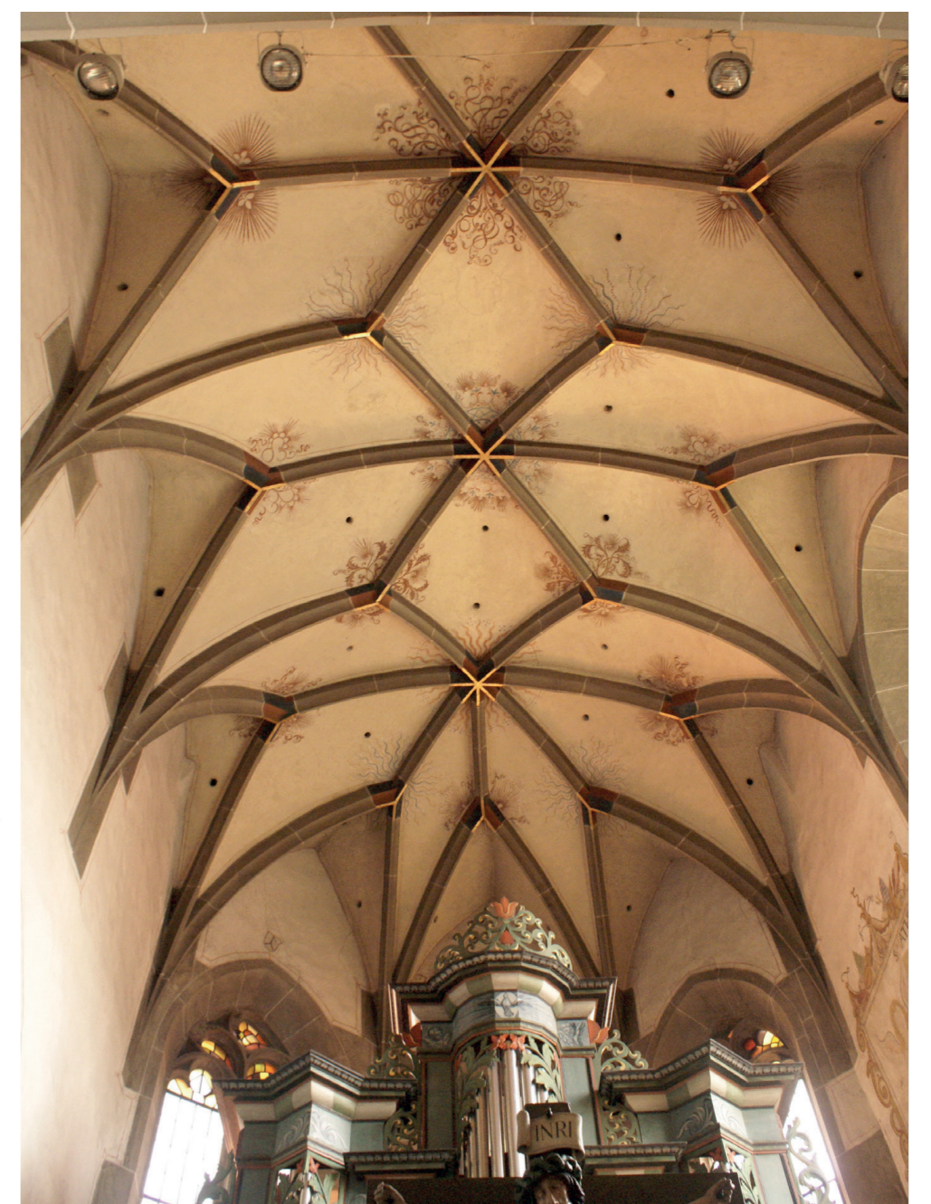
Blick auf das Sternrippengewölbe von 1499.

© FOTOS UND PLAN: TILMANN MARSTALLER, ROTTENBURG-OBERNDORF PLANGRUNDLAGEN: ARCHITEKTURBÜRO KIEFNER UND MÜLLER, MAULBRONN KIRCHENFÜHRER VON MATTHIAS KÖHLER, 1991