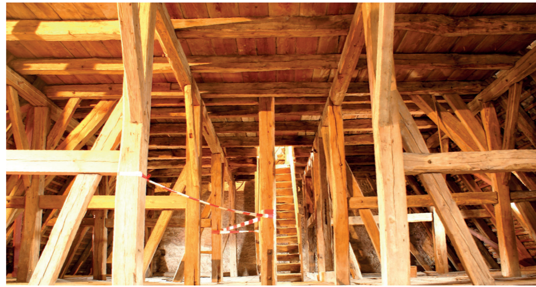
Blick in das Dachwerk von 1467.